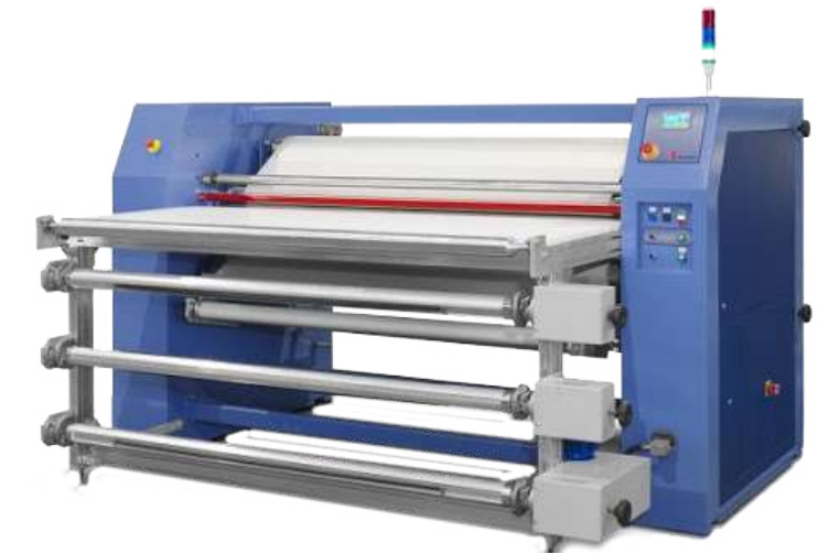
IMPRESORAS PARA SUBLIMACIÓN

impresora cama plana hibrida tintas U.v. rollo a rollo.