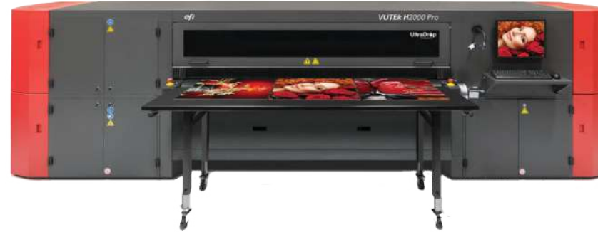
IMPRESORAS PARA MATERIALES RIGIDOS Y FLEXIBLES

PLOTTER de sublimación Ancho máximo de 150cm