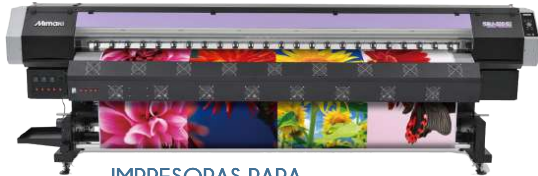
IMPRESORAS PARA MATERIALES FLEXIBLES