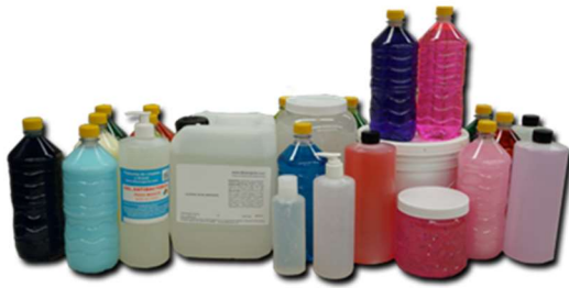
ARTÍCULOS DE LIMPIEZA