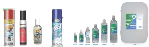
ARTICULOS Y SERVICIOS DE SANITIZACIÓN