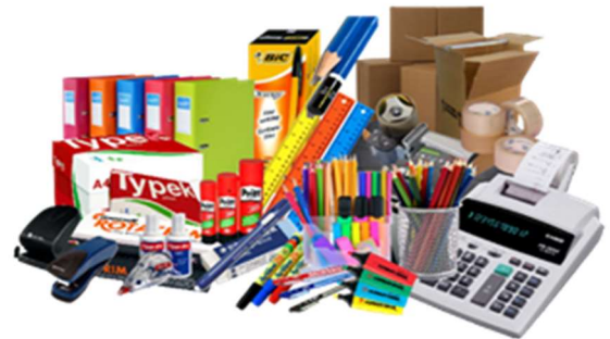
ARTÍCULOS DE PAPELERIA