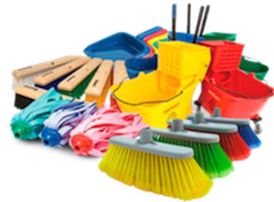
ARTÍCULOS DE JARCERIA