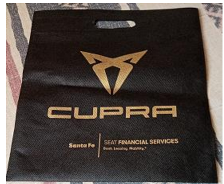
CUBREBOCAS & GUARDA-CUBREBOCAS