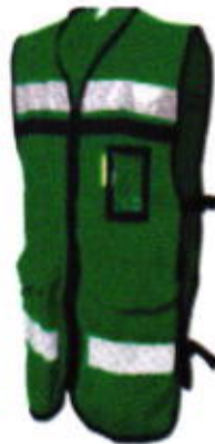
Chaleco rescatista de gabardina abierto