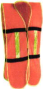
Chalecos de malla con bias de alta visibilidad y reflejante térmico

Cinta elástica afelpada de 19mm de ancho.