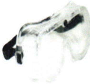
Goggles de ventilacion directa