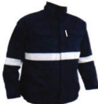
Camisola ignifuga con reflejante