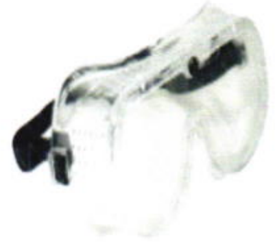
Goggles anti-empañantes de ventilacion directa