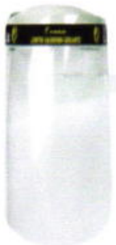
Protector facial contra salpicaduras de liquidos