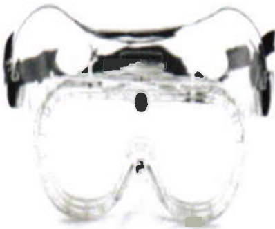
Goggles de ventilacion indirecta