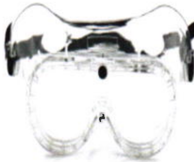
Goggles anti-empañantes de ventilacion indirecta