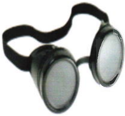
Gafas para soldador