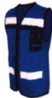
Chaleco rescatista de gabardina cerrado

Chaleco de gabardina con ajustes en los costados, que permite que usuario sea visto fácilmente para evitar accidentes gracias a sus