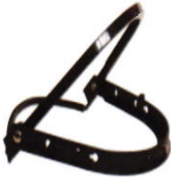
Adaptador de abis para casco