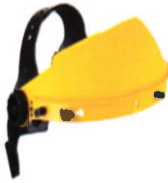
Cabezal para protector facial