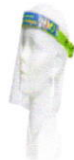
Protector facial infantil para niño