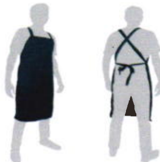
Mandil ignifugo (sobre pedido)