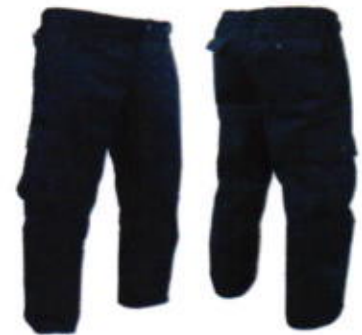
Pantalón ignifugo (sobre pedido)