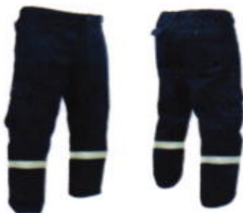
Pantalón ignifugo con reflejante (sobre pedido)