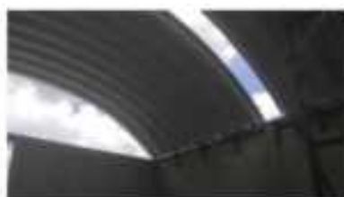
Cubierta autoportada. Jiutepec Morelos.