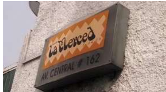
Imágenes del acceso de la planta