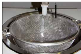
la semilla es drenada en un colador