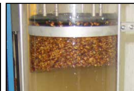
semillas con grietas se hundirán