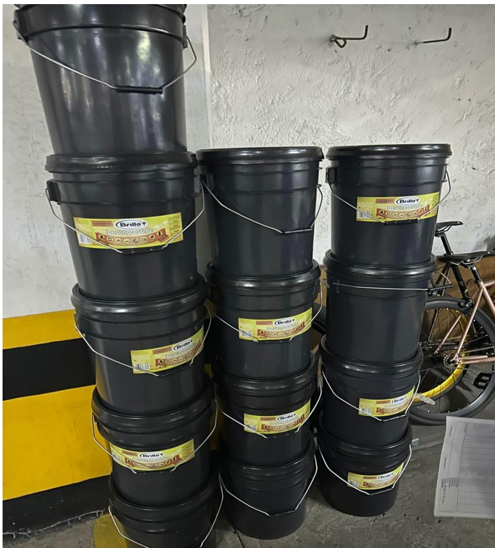
Entrega de artículos de limpieza

"Proveedor de confianza, aliado para tu éxito"