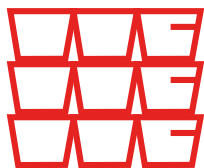
Sow de 400-800 kg