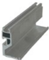
Riel Rack - Perfil solar