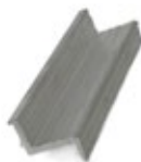
Perfil Z - Perfil solar