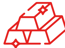
Lingote de 10-12 kg