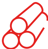
Billet de 5", 5.5" y 7"