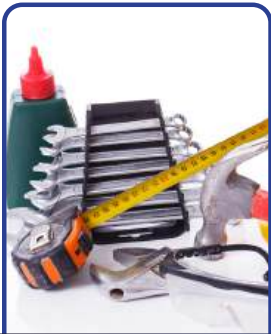
Material de Construcción