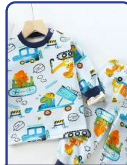
Diseño y Confección de Prendas de Vestir