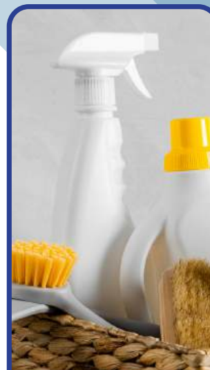
Enseres de Limpieza