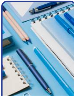
Suministros de Papelería