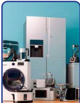
Línea Blanca y Electrodomésticos