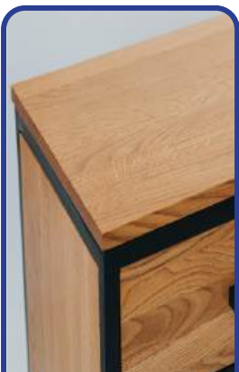
Mobiliario de Oficina