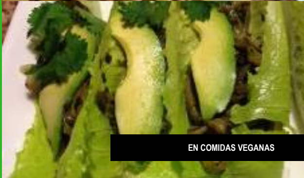
EN COMIDAS VEGANAS