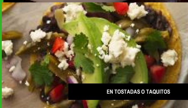
EN TOSTADAS O TAQUITOS